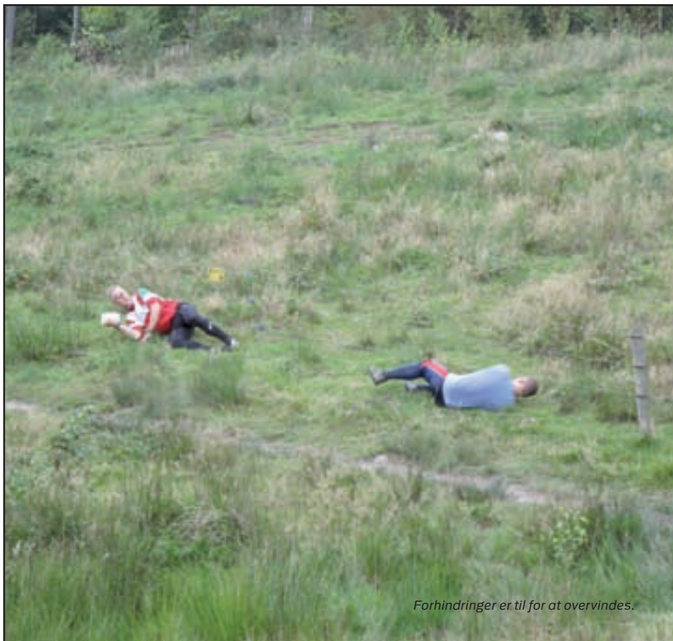
Forhindringer er til for at overvindes.