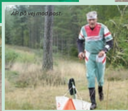
AP på vej mod post.